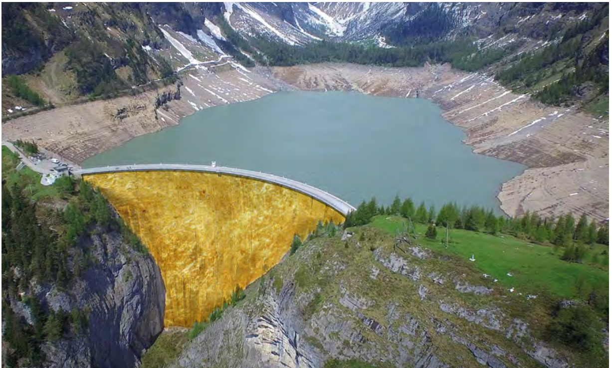
ANDY PICCI, PARTICIPANT 2017 CATÉGORIE PHOTO

Les repas du soir sont à la charge de l'organisation (CMTC).