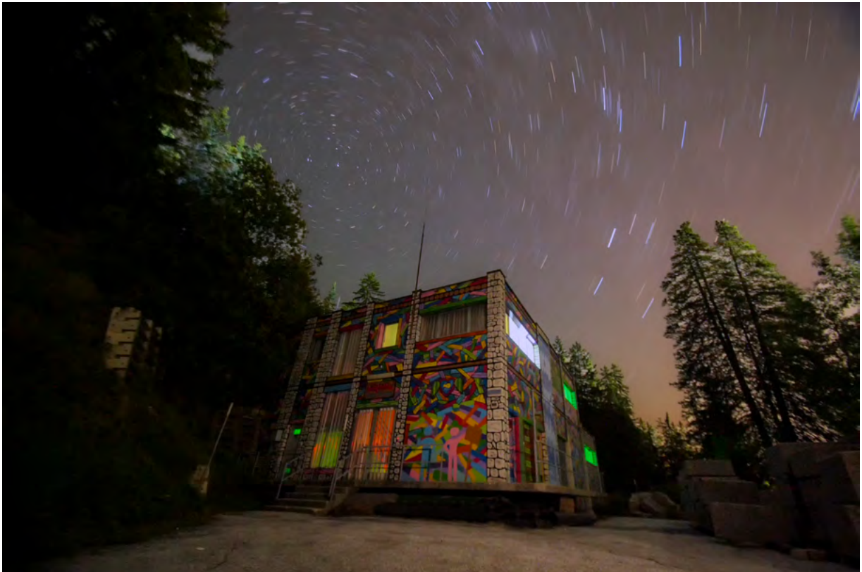
MASSIMO PRATI, PARTICIPANT 2017 CATÉGORIE PHOTO