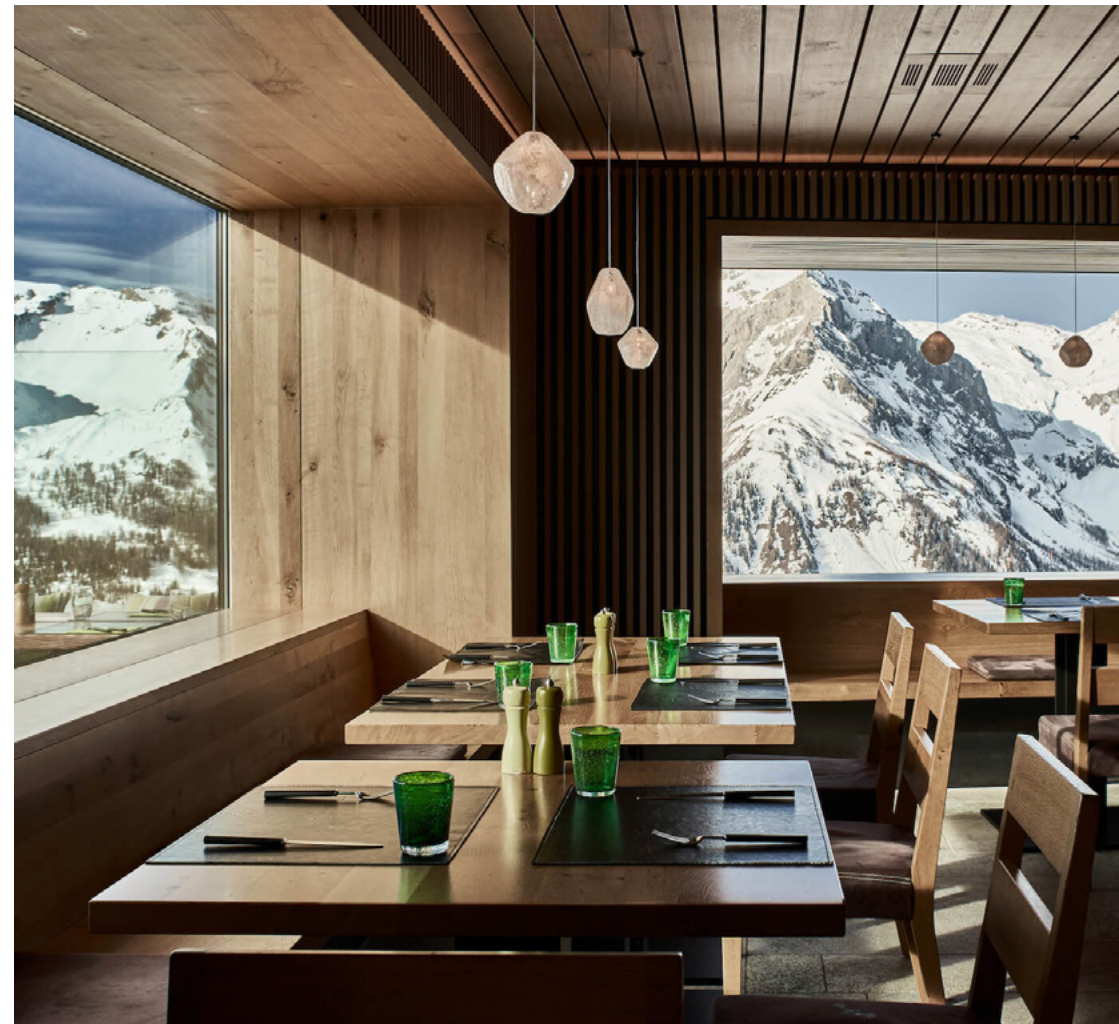
Restaurant & Lounge | 138 m 2