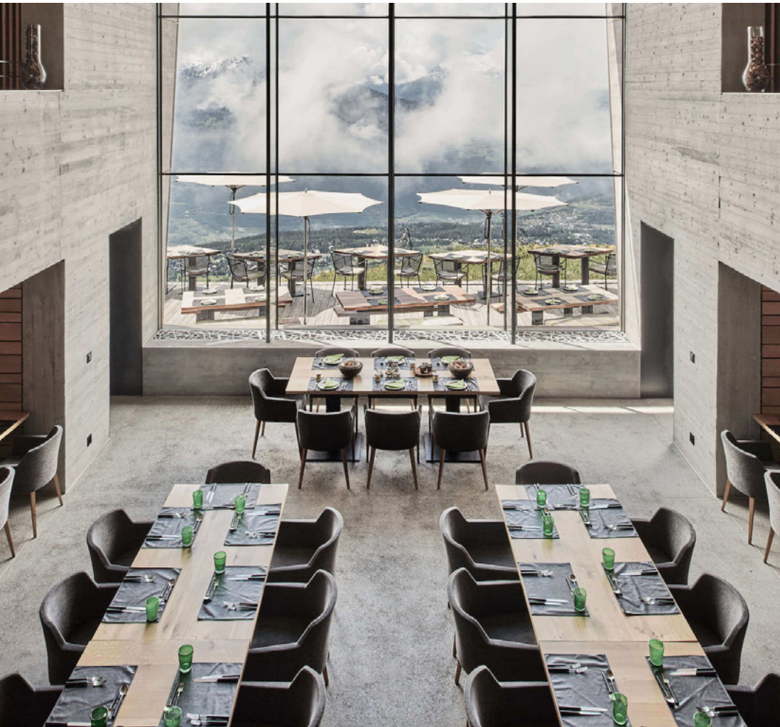
Privates Esszimmer | 145 m 2

Genießen Sie während Ihrer Mahlzeiten einen atemberaubenden Blick auf die höchsten Gipfel der Alpen. Unser privates Esszimmer, das Restaurant und die Terrassen bieten eine atemberaubende Kulisse, ideal um frische Energie zu tanken.