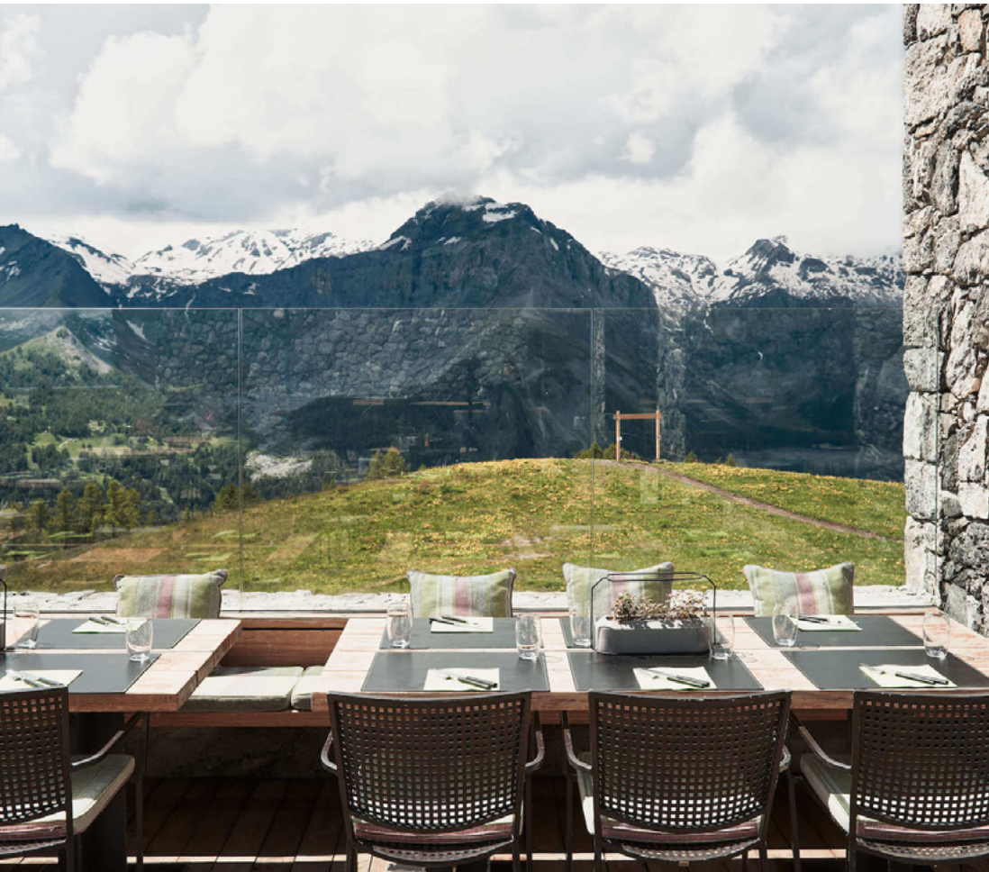
Hauptterasse | 180 m 2

Wir bieten Ihnen verschiedene Innen- und Außenbereiche für Ihre Empfänge und Aperos . Auch Workshops in Kleingruppen können in verschiedenen Räumlichkeiten durchgeführt werden, die der Kreativität und Konzentration förderlich sind.