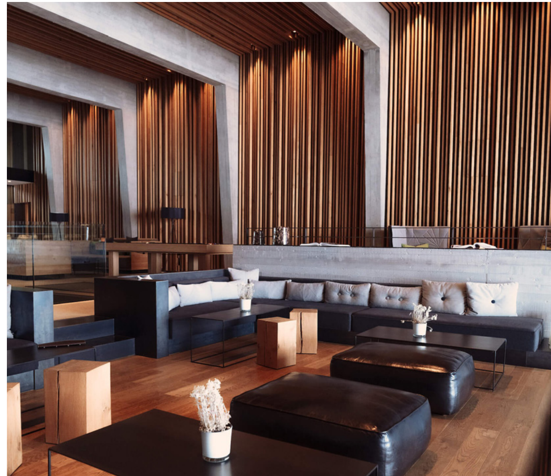
Lobby & Bar | 248 m 2