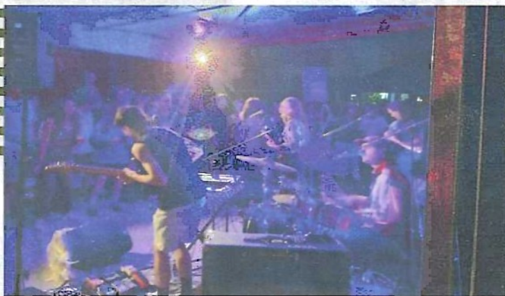
Scène de la Cabane