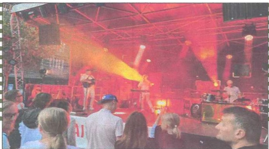
Concert de Carrousel