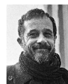
Claude Barras réalisateur