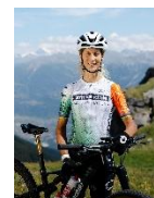
Jolanda Neff vététiste