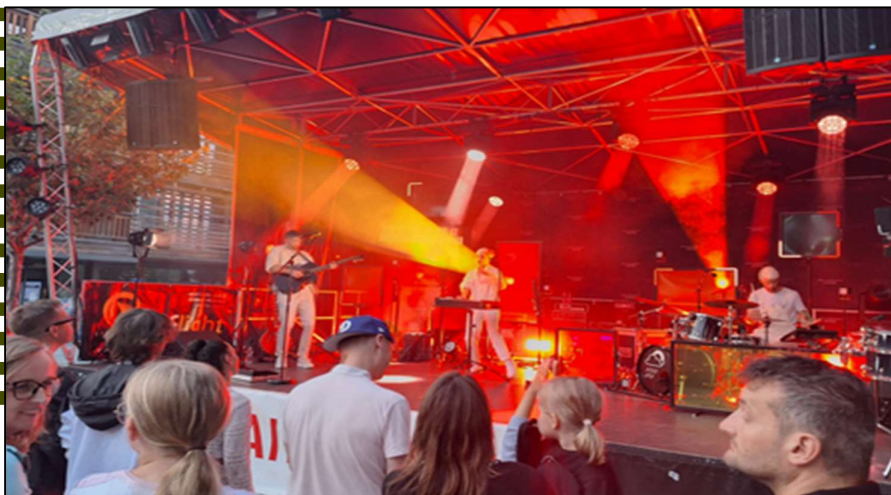
Concert de Carrousel